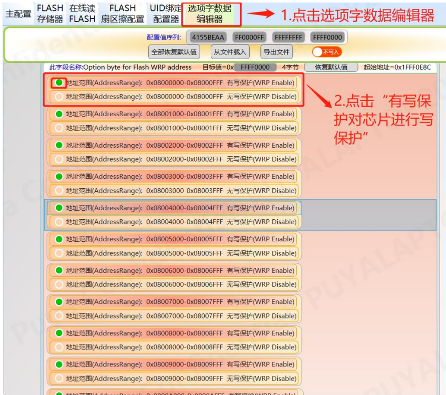
图 17-1 轩微操作 Option 写保护